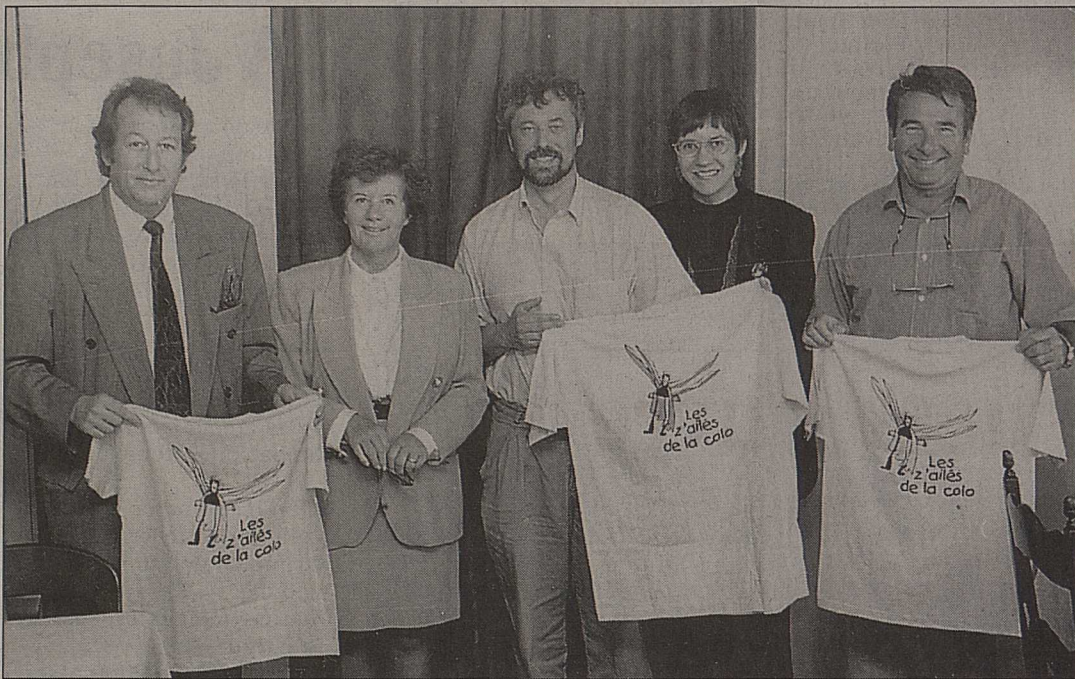
Le comité d'organisation des festivités qui marqueront les quarante ans de la colonie de Ravoire, les 10 et 11 juin prochains.